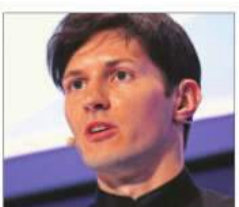
Pavel Durov is being held in custody as part of a cyber criminality investigation, a prosecutor said on Monday

Though there has been no official French comment on the arrest, French news channel