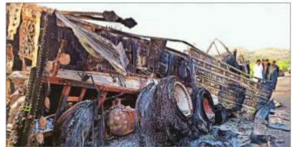
People look at a burnt vehicle after militants conducted deadly attacks in Balochistan on Monday

BEIJING URGED THE US to "stop its wrong practices" after Chinese companies were included on a sanctions list that's designed to target supply chains feeding Russia and hobble its wartime economy, the ministry of commerce said. —BLOOMBERG