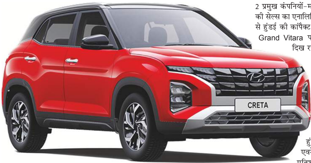
जयपुर@नफा नुकसान रिसर्च

देश में SUV कारों के लिए दीवानगी पिछले कुछ समय से सिर चढ़कर बोल रही है। महंगी होने के बावजूद स्टाइल स्टेटमेंट के