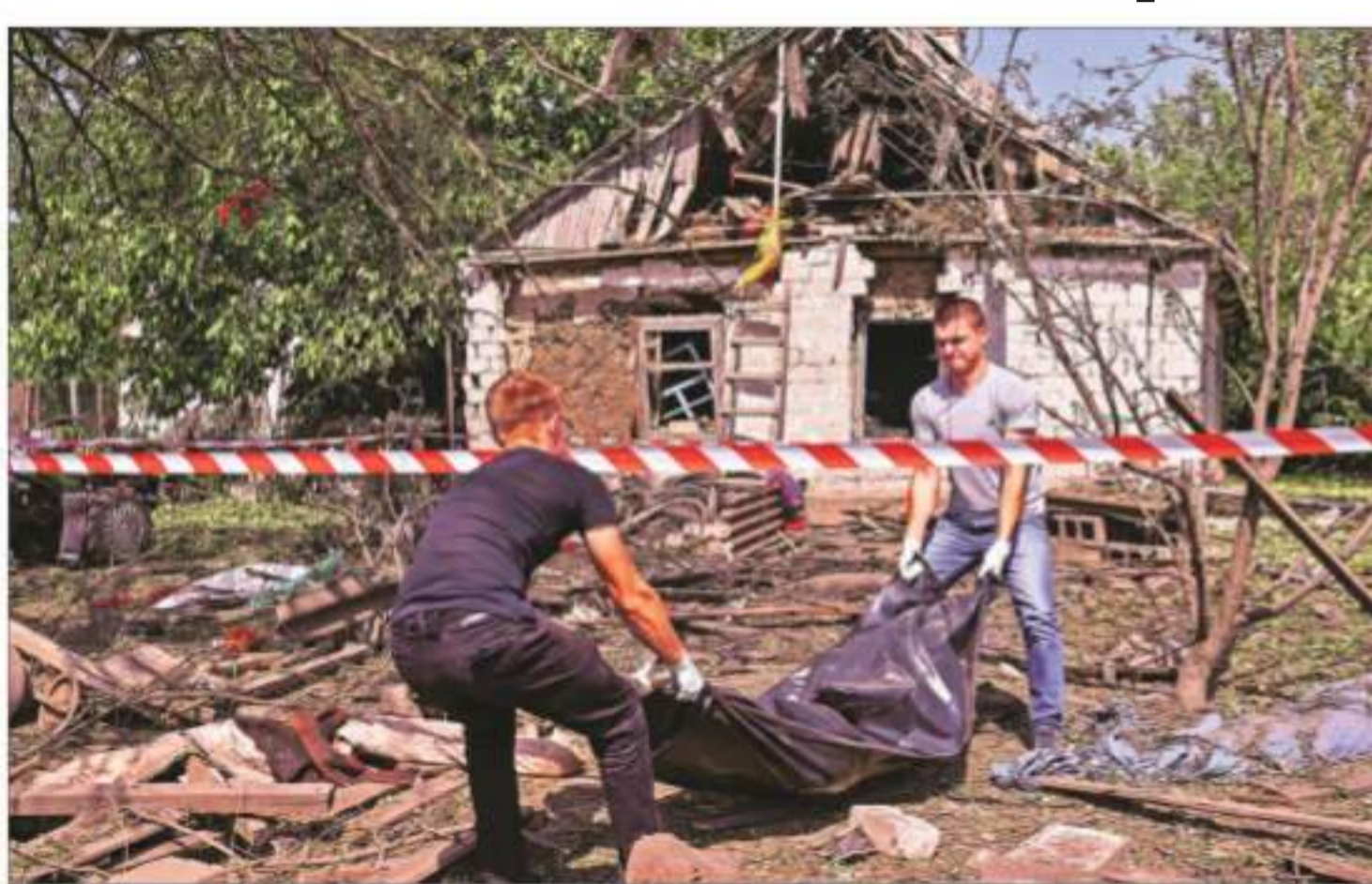
Men carry the body of a local resident killed by a Russian missile strike in the village of Novohupalivka in Zaporizhzhia region on Monday

Monday's missile and drone salvo was Russia's most intense in weeks, coming as Ukraine is claiming new ground in a major cross-border incursion into Russia's southern Kursk region while Russian forces steadily inch forward in