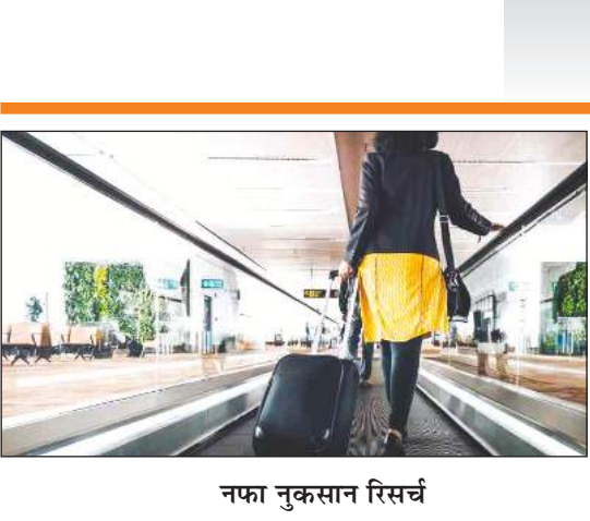
नफा नुकसान रिसर्च

इकोनॉमिक क्राइसिस में फंसी यूके सरकार नॉन-डॉम पॉलिसी में बदलाव के कारण बड़ी तादाद में विदेशी मिलिनेयर की उड़की को देखते हुए अब हल्का चलने की तैयारी रही है। यूके की फाइनेंस मिनिस्टर रशैल रिक्स ने हाल ही कहा कि सरकार नॉन-डॉम (गैर नागरिक) कम्प्यूनिटी की चिंताओं को सुनने के बाद कानून में जरूरी बदलाव करेगी।